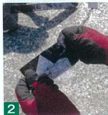
2 フィルムを剥がす