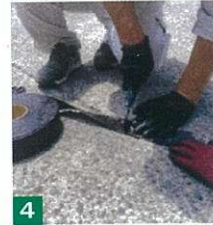
4 必要な分量でカット