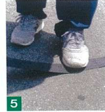
5 足で踏んで体重をかけて 圧着させる